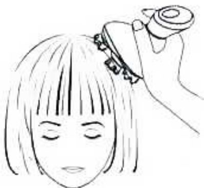
Masáž hlavy na sucho